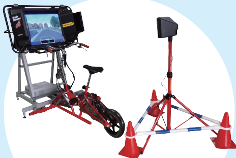
自転車シミュレータ