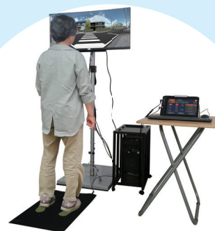
歩行者シミュレータ