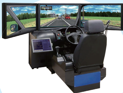
運転シミュレータ

動体認知診断は、高次脳機能障害の方を対象とした 運転再開支援にもご活用いただいております。