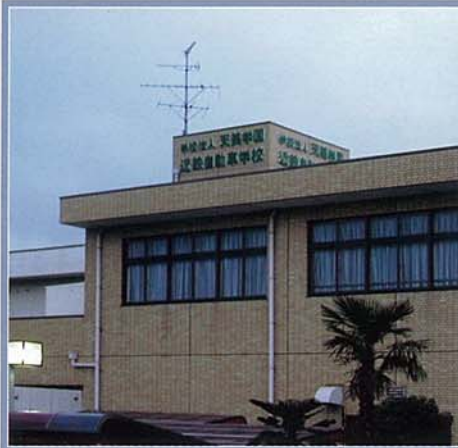
学校法人 天美学園 近鉄自動車学校様 (大阪府松原市)

親切・丁寧な指導に定評があり、免許取得者約13万人の実績を誇る近鉄自動車学校。屋外の自動二輪車の技能教習に、防水性能に優れたアイコム業務用無線機が活躍。