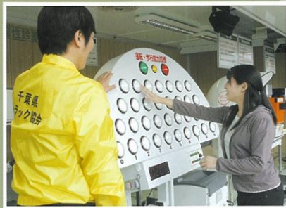
運転・歩行能力診断

ドライバーも、歩行者も、交通場面で必要な「認知・判断・動作・瞬間記憶」能力を診断し、あなたの弱点を分析します。そして、それを常に意識して行動することが安全に過ごすことにつながります。（所要時間約5分）