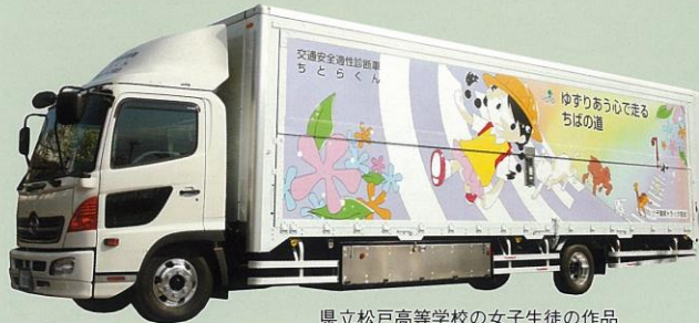
県立松戸高等学校の女子生徒の作品

本車両は、皆様に親んでもらうため、愛称を一般公募し、多数のご応募をいただいた中から、酒々井町在住の女性の「ちとらくん」が選ばれました。車体デザインは、千葉県教育庁のご協力により、県立松戸高等学校の女子生徒の作品と県立市川工業高等学校の女子生徒の作品が選ばれました。また、車体後部には、2010年に千葉県で開催される「ゆめ半島千葉国体」マスコットキャラクター「チーバくん」がデザインされています。