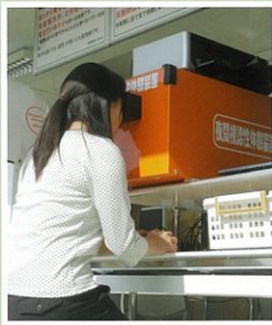
夜間の視認性体験

まっすぐ前を見ている時に、上下左右前方が、どれ位の範囲まで見えているのかを調べる検査です。「視野」は40歳代からどんどん狭くなっていきます。視力は良くても「視野」が狭いと大変危険です。（所要時間約3分）