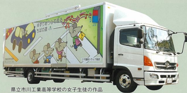
県立市川工業高等学校の女子生徒の作品