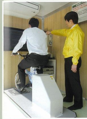
自転車シミュレータ

奥行きや距離感、立体感をどれくらい正確に判断できるのかを検査します。運転中の右左折時、歩行中の横断時には、接近してくる車両との正確な距離感が必要です。（所要時間約1分）