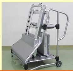
モニタースタンド 制御用パソコン