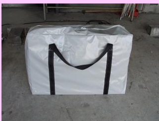
フロントモニター