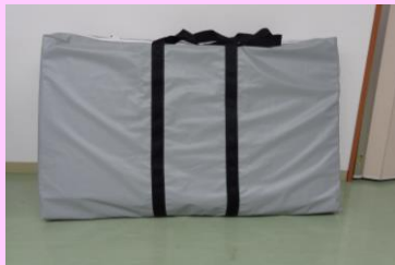
モニタースタンド上部ケース