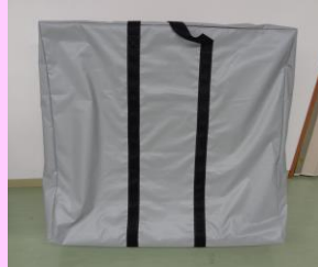
モニタースタンド下部ケース