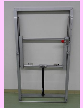
モニタースタンド上部