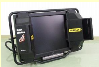
フロントモニター