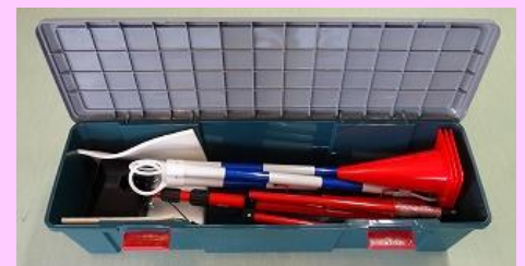
後方確認モニター