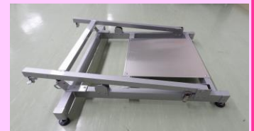
モニタースタンド下部