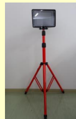
後方確認モニター